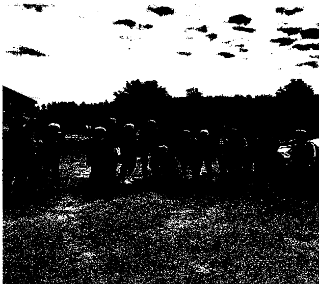
KULpåTUR, Moelv Frivilligsentral turgruppe

Kontoret har administrert utleie. Dette innebærer utleiekontrakt, omvisning, kontorarbeid, innkjøp og oppsyn med lokalene. Selskapet driver ikke virksomhet som forurenser det ytre miljøet.