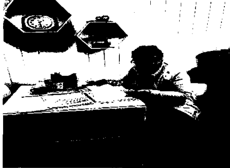
Småjobbsentralen, vært aktive hele 2020