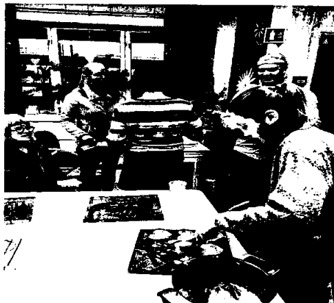
Såpekurs til TV aksjon på Moelv Frivilligsentral

Selskapets driftsinntekter var på kr 822.893 i 2020.