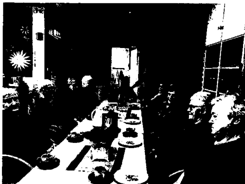
Tirsdagstreff i februar 2020