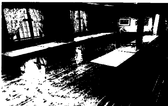
Utleie lokaler på Garveriet 2020

Ring en venn. Frivillige ringte rundt til tilfeldige innbyggere i Moelv for å slå av en prat, for å forhindre ensomhet i nedstengt tid i samfunnet.