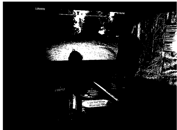
Løp for livet er et populært tilbud både for liten og stor. Årsberetning 2021, 4

Til åpningen av sommersesongen ble det realisert en ny avdeling i senteret. Det gamle «Energispillet» ble faset ut, og inn kom aktivitetene «Løp for livet», «Mindball», «Mindball Play» og «Tre på rad». Aktivitetene er spesielt rettet mot barn og unge, og det nye tilbudet ble svært godt mottatt.