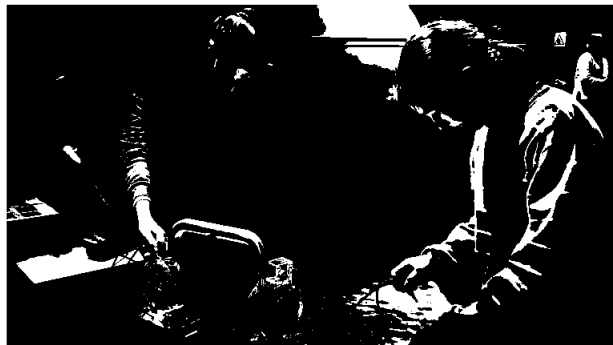
I «Energiløypa» for 7. trinn skal elevene eksperimentere og arbeide praktisk. Her er det turbiner og generatorer som utforskes.

To nye undervisningsopplegg ble realisert. Planleggingen har pågått over en lengre periode, men det offisielle tilbudet til skolene åpnet først på slutten av året. Det betyr at både 7. og 10. trinn nå har reelle valgmuligheter for hva de ønsker vektlagt når de besøker senteret. Det nye tilbudet for 10. trinn har fått navnet «Energispillet», og for 7. trinn, «Energiløypa».