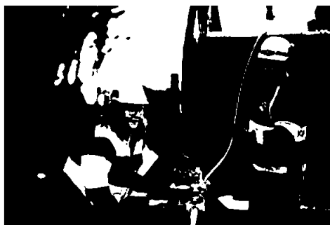
Arbeid med fiberkabel

Av dei fast tilsette er ei kvinne og sju menn. Selskapet ynskjer å rekruttere fleire kvinnelege lærlingar og for 2022 er det tilsett kvinneleg lærling. Selskapet har ingen midlertidige tilsette i 2021.