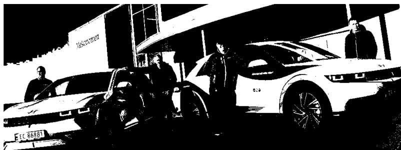
Våre nye miljøvennlige bilar

Ved kjøp av nye bilar i 2021 valte ein å kjøpe elbilar med lang rekkevidde. For å få tak i bilar med lang nok rekkevidde og drift på alle hjula, måtte ein velje bilar med fem seter. Det er eit paradoks at skattereglar gjer at bedrifta tapar økonomisk på å bruke slike bilar i vakttenesta samanlikna med eldre varebilar med dieselmotor.