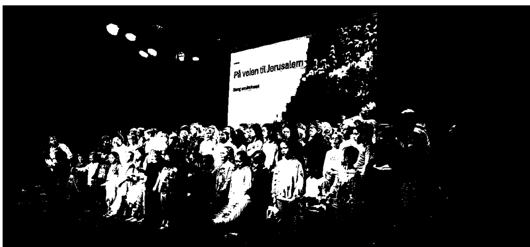
Påskesamling i gymsalen – sang av småtrinnet.

Fra styret for foreningen Danielsen Barne- og Ungdomsskule Sotra Organisasjonsnummer 989 077 716 Adresse: Idrettsvegen 20, 5353 Straume