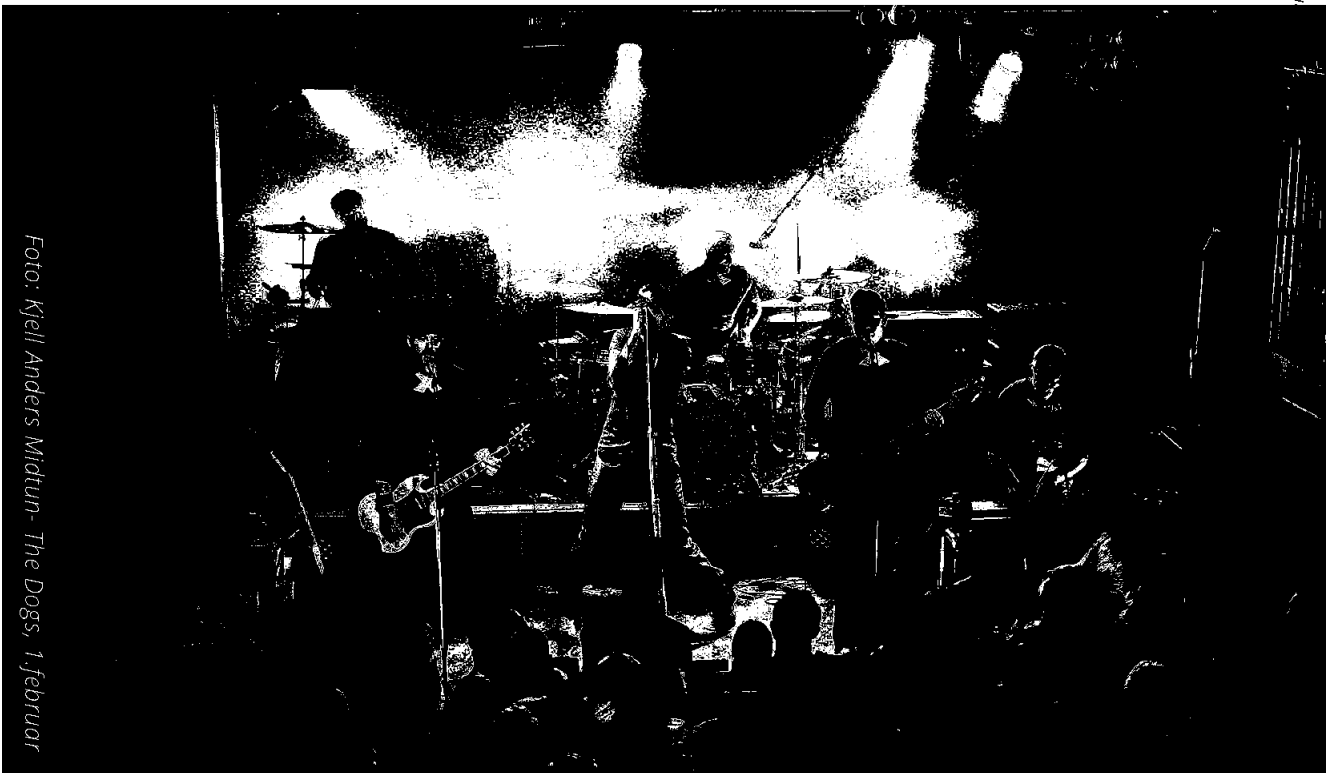
The Dogs, 1 februar

mentnokiel.EQUU4-828UK-TK007-AGZKK-ESPTV-TF5FA