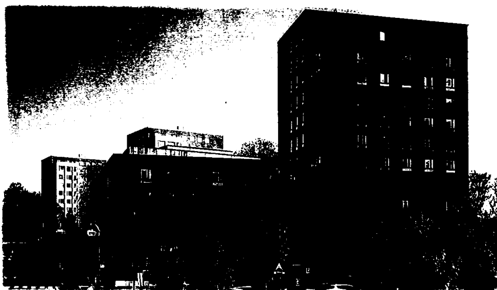
Blindernveien 6, Oslo. Ca 300 studentboliger, barnehage, næringsarealer og parkeringskjeller. Overlevert til Studentsamskipnaden i Oslo, SiO - mars 2021.