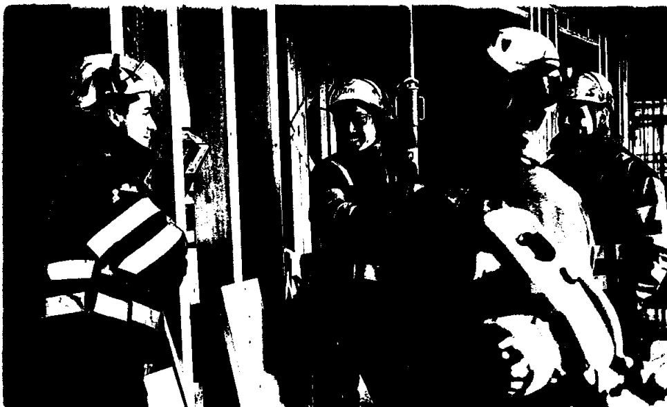
Trivsel hos ansatte er viktig! Her fra Tindlund Park, byggetrinn 4 - blokk nord.

Alle skader med og uten fravær samt alvorlige hendelser, følges opp særskilt. Opplæring og kursvirksomhet har fremdeles høy prioritet. Dette gir økt kompetanse for de ansatte og minimerer faren for uhell. Arbeidsmiljøet betraktes som godt. Det vurderes fortløpende tiltak for å opprettholde det gode miljøet. Det vises for øvrig til Arbeidsmiljøutvalgets årsrapport for 2021.