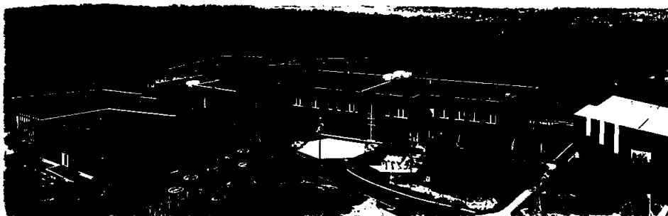
Hvaler skole, Asmaløy. Ny barneskole med et samlet bruksareale på 5.210 m 2 , oppført med yttervegger og etasjeskiller i massivtre. Overlevert juni 2021.