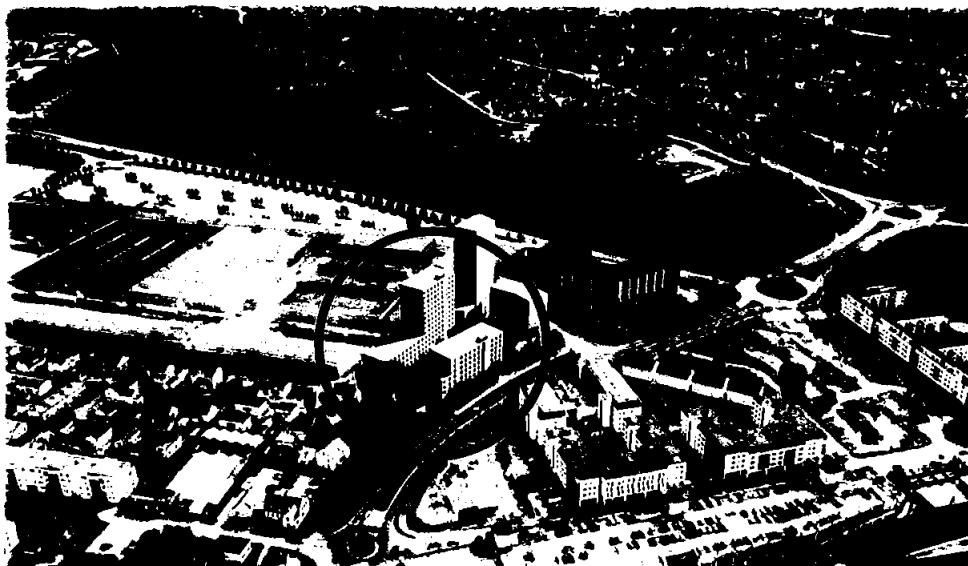
Lillestrøm studentby, ca 300 studenthybler fordelt på to blokker på hhv. 7 og 12 etasjer, med et totalt bruttoareal på ca 12.300 m 2 . Overleveres september 2023.