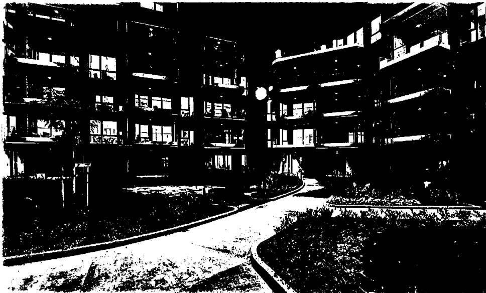
Kulås Hage, Sarpsborg. 94 leiligheter over felles parkeringskjeller samt noe næringsarealer. Salgstrinn 1 overlevert i juni/juli, salgstrinn 2 overlevert i november 2021.