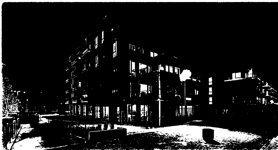
Kulås Hage, Sarpsborg. 94 leiligheter over felles parkeringskjeller samt noe næringsarealer. Salgstrinn 1 overlevert i juni/juli, salgstrinn 2 overlevert i november 2021.

Utvikling av egenregiprosjekter i Ove Skår Gruppen foregår gjennom hel- eller deleide søsterselskaper til Ove Skår AS. Normalt vil Ove Skår AS være entreprenør for utbyggingen i disse selskapene.