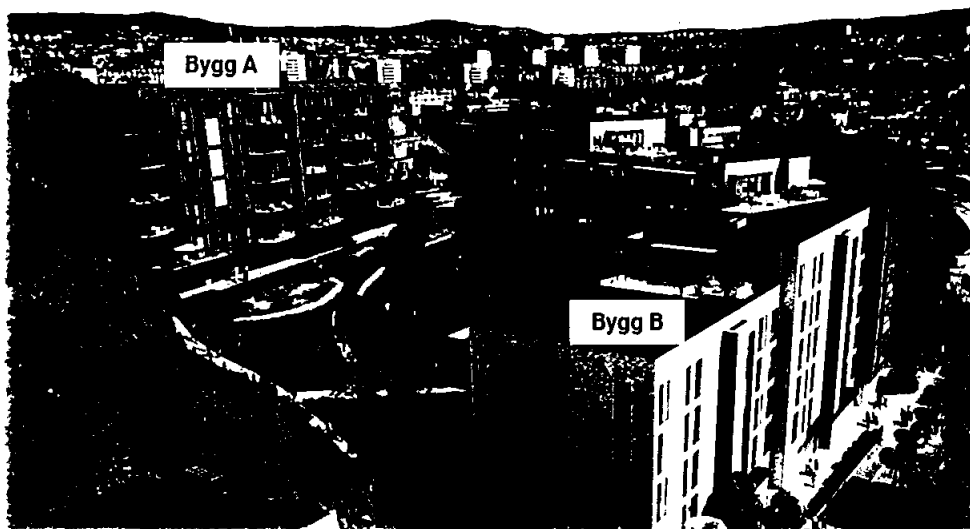
Brattlitoppen, Ryen - Oslo, to boligbygg med henholdsvis 32- og 75 leiligheter over felles parkeringskjeller. Overleveres Q2/Q3 2023.

Styret i selskapet har ikke inngått avtale om styreansvarsforsikring.