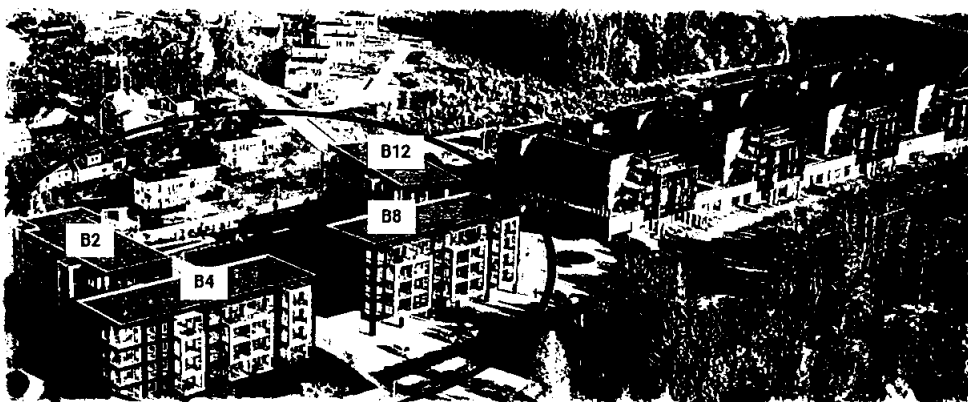
Knapstadhagen, Indre Østfold. 80 leiligheter over felles parkeringskjeller. Overleveres Q2 2023.

Selskapet har for tiden ingen pågående forsknings- eller utviklingsaktiviteter.