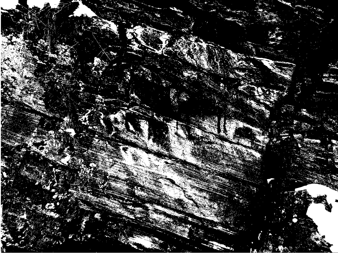
Bergkunst ved Espedalsvannet i Innlandet. Bildene er behandlet så detaljene kommer fram. NIKU jobber tverrfaglig med dokumentasjon og undersøkelse av bergkunst, og dette prosjektet ble gjennomført ved ansatte fra tre av NIKUs avdelinger.

Penneo Dokumentnøkkel: 17DES-7ELQH-P2X0A-YZJ85-C55F5-00TAM