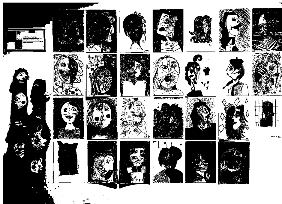
Inspirasjon fra spansk kunstner Pablo Picasso ifm. portrettarbeid (kunstelever fra 3-7. trinn)