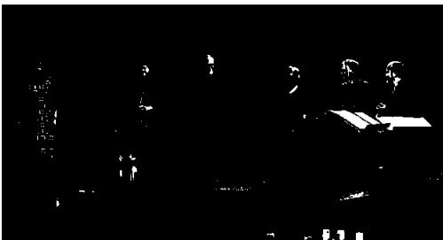
Fra forestillingen Inferno på Tysværtunet