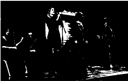
Fra Lys i Ýlir med Rags and Feathers og Munor på Tønnefloftet, Staalehuset

Tittelen betyr Lys i desember og var en juleturné i samarbeid med folkbandet Rags & Feathers. Det var den andre feiringen av 40-års jubiléet for profesjonell musikerordning i Nord-Rogaland. Planen var 9 konserter, 5 på institusjoner i Karmøy kommune og 4 kveldskonserter. Institusjonskonsertene lot seg gjennomføre uten problem og gikk svært bra. Av kveldskonserterne måtte to av dem avlyses pga korona, i Tysvær og Bokn kommuner. De andre ble avvirket, en i Falnes kirke og en på Staalehuset.