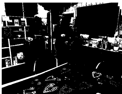
Klare for å henge ut hjertene til Hjerteløypa