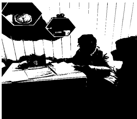
Telefonvakt på Småjobbsentralen