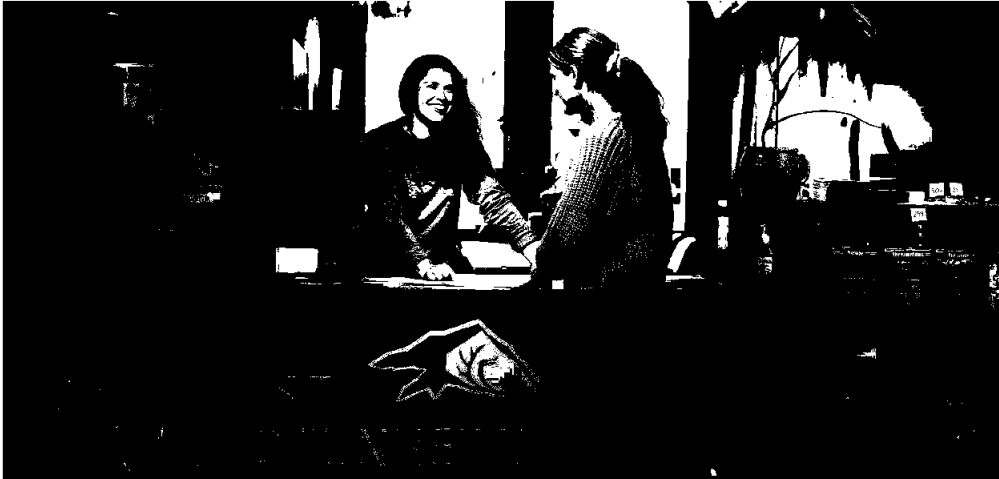
Turistinformasjonen i Lom.

Resten av året har dagleg leiar og fjellseljar ansvar for førespurnadar til turistinformasjonen sin telefon og e-post, og dørene er opne for besøk kvar dag gjennom heile året, med unntak når dagleg leiar eller «fjellseljar» arbeider utanfor kontoret.