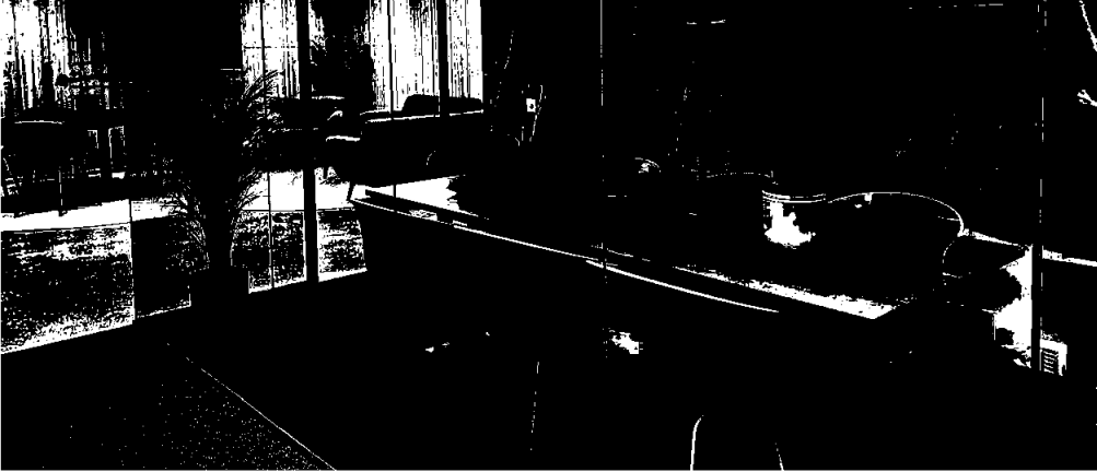
Nytt kontorfellesskap på Nilsbue frå hausten 2022