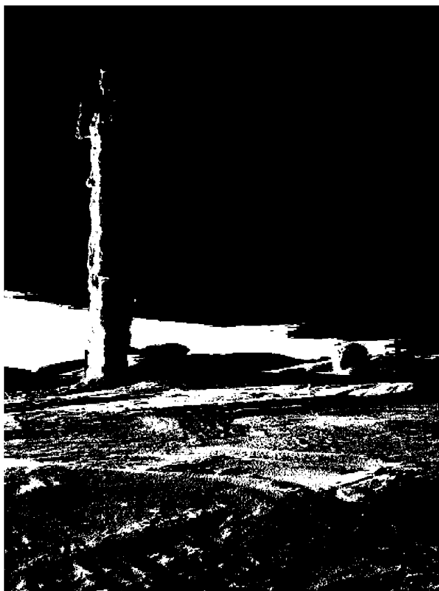
Mobil og nødnettmaster på Lavkasoppen.