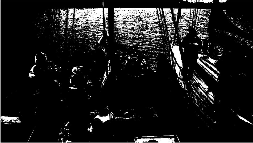
Eit snakkast på fjorden-møte mellom seksæring, jekt og havsegjar. Skuleelevar frå Austebygd skule på Radøy møter Sunnivaseglasen utanfor Sletta kai 3. september.