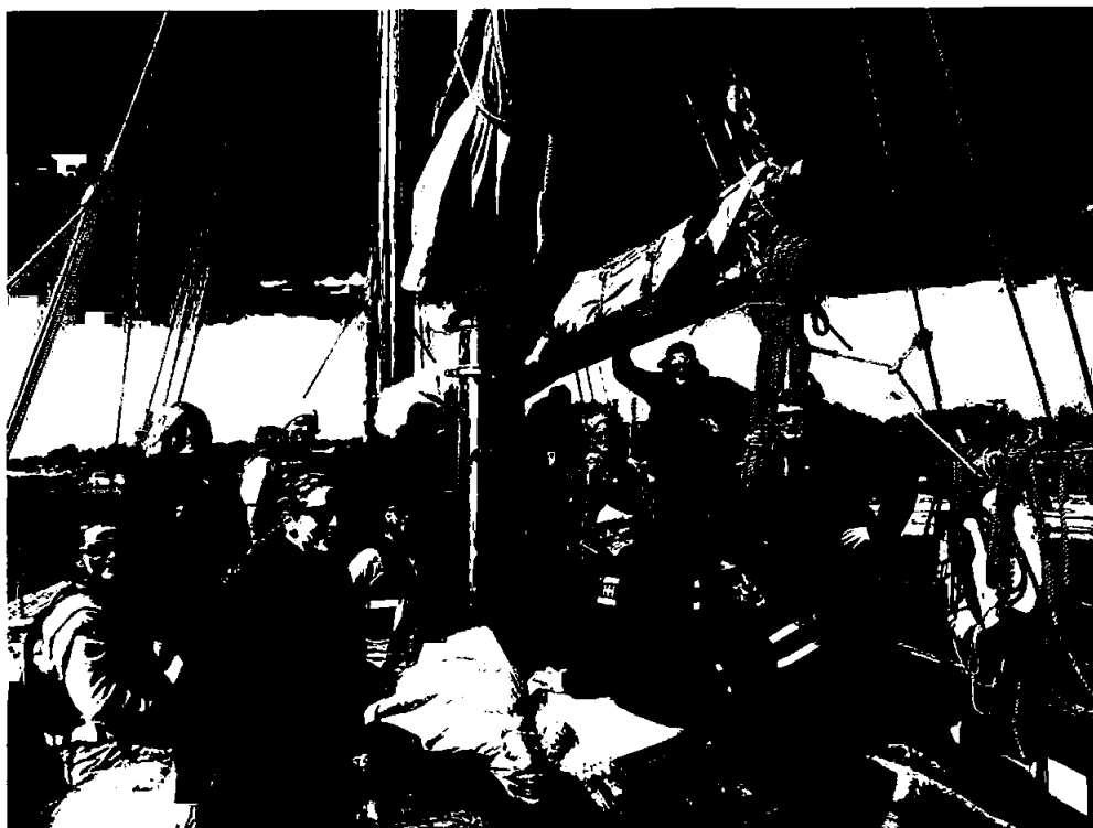
Årsmelding for Stiftelsen Grenland Folkehøgskole 2024

GRØNLAND FOLKEHØGSKOLE VED KYSTEN AV TELEMARCK