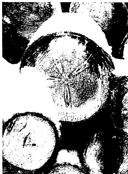
Frossent sagtømmer 2020.

LANGSIKTIG PROFESJONELL IMOTEKOMMENDE NYTENKENDE