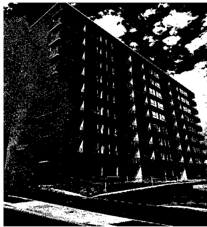
Enerhaugen studenthus for SiO