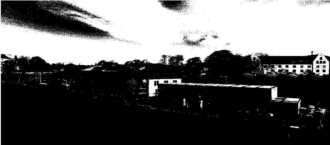
Skur 38 for Oslo Havn