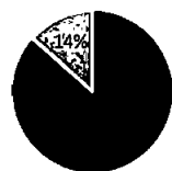
Nettoomsättning per rörelsegren

Nedan diagram visar koncernens nettoomsättning per 31 december fördelat per koncernens tre segment samt per land.