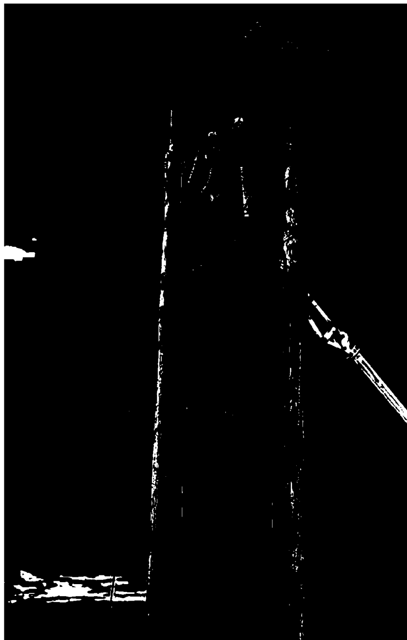
Bildet er fra rivning av linje ved Buslett, nå lagt i kabel.