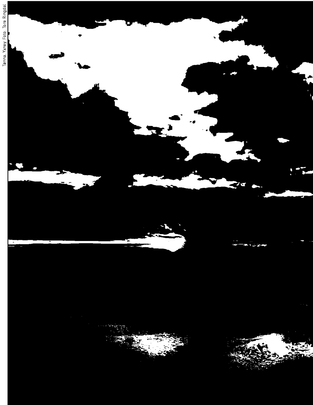
Jenna, Xnxy