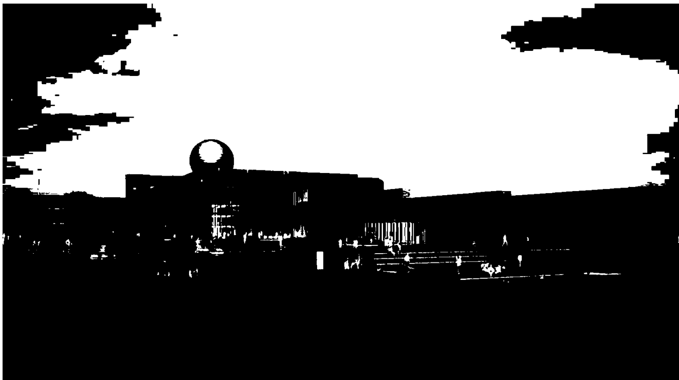
Illustrasjon: Eksteriørperspektiv, Dora 2 (Brendeland & Kristoffersen Arkitekter AS)