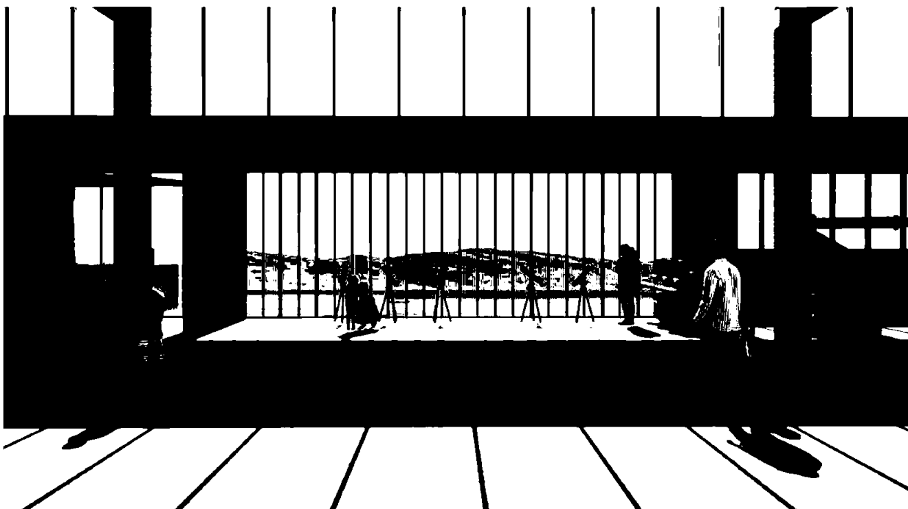
Illustrasjon: Utsikt mot fjord og Nyhavna, Dora 1 (Brendeland & Kristoffersen Arkitekter AS)