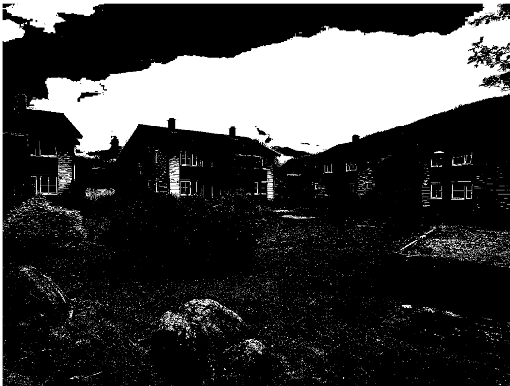
Foto av fellesområde / leikeplass juni 2022.