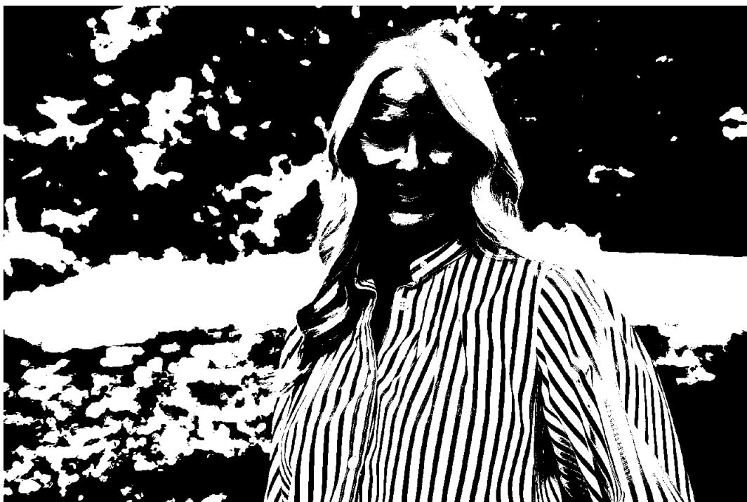
H.K.H. Kronprinsesse Mette-Marit.

Stiftelsen Fullriggeren Sørlandet har mottatt den gledelige meldingen om at H.K.H. Kronprinsesse Mette-Marit vil være beskytter for "Sørlandet" i perioden 2021 - 2025. Styret retter en spesiell takk til H.K.H. Kronprinsesse Mette-Marit, kronprinsessens støtte er spesielt verdifull siden kronprinsessen er fra Kristiansand og svært representativ for Norge og Sørlandet når skuta besøker havner i utlandet.