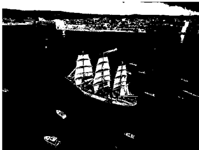
For fulle seil helt til kai.

Datterselskapet A+ World Academy GmbH chartret skoleskipet Sørlandet som vanlig i skoleårene og seilte med 60 elever i 2022/2023, og seiler med 66 elever skoleåret 2023/2024. De besøkte 15 havner og krysset Atlanteren flere ganger det kalenderåret.