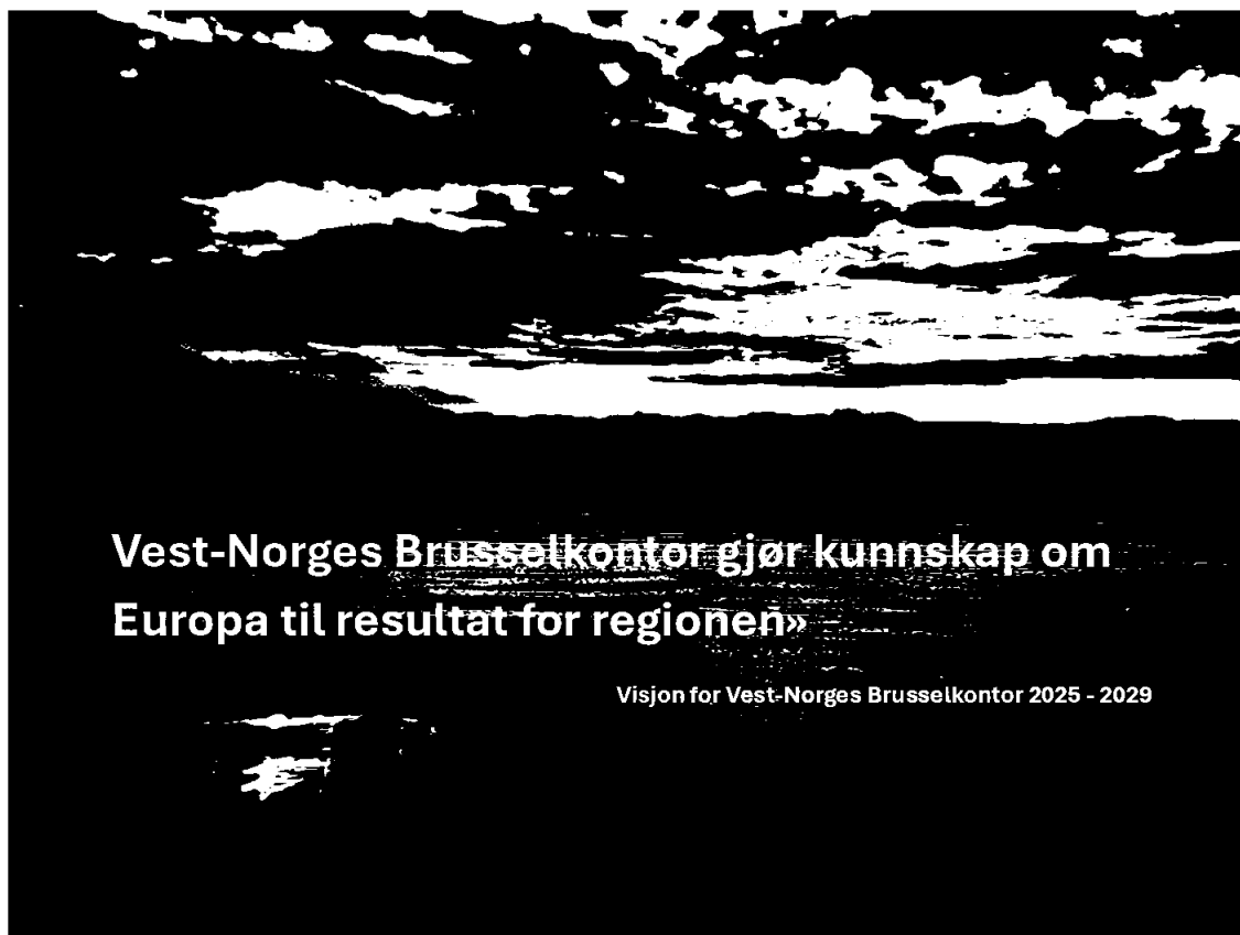
Øystese, Foto: Merete Mikkelsen, VNB

Nå ser vi frem til å fortsette det videre arbeidet med implementeringen av strategien i samarbeid med administrasjonen og medlemmene. En ny medlemsdrevet ressursgruppen vil spille en sentral rolle her og være en viktig støtte for VNBs ansatte. Sammen er vi klare til å gripe mulighetene i det europeiske samarbeidet for å skape gode resultater i vår region.