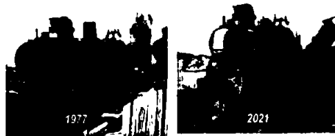
Foto av lokomotivet fra 1977 og fra 2021 viser tydelig hvor fort nedbrytingen skjer

Tunheim med driftsapparat for kullutvinning, transportårer/infrastruktur, utskipningsanlegg, bygninger mv. Dette først og fremst fordi nedbryting er i ferd med å radere bort forståelsen av sammenheng og helhet i gruvebyen samtidig som enkeltobjekt mister sin lesbarhet.