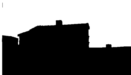
«Gamle Reserven».

Kings Bay AS anbefaler at det gjennomføres tilstandsvurdering med dokumentasjon av verneverdi og restaureringsbehov for «Gamle Reserven» som ligger i tilknytning til Bjørnøya meteorologiske stasjon. Bygget er sannsynligvis fredet, men ikke registrert i Askeladden.