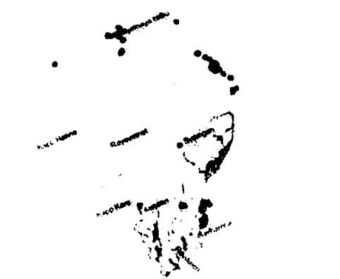
Registrerte kulturminner Bjørnøya (askeladden.no)

Bjørnøya ligger i Barentshavet mellom Svalbard og fastlandet. Øya er ca. 178 kvadratkilometer. Den nordligste