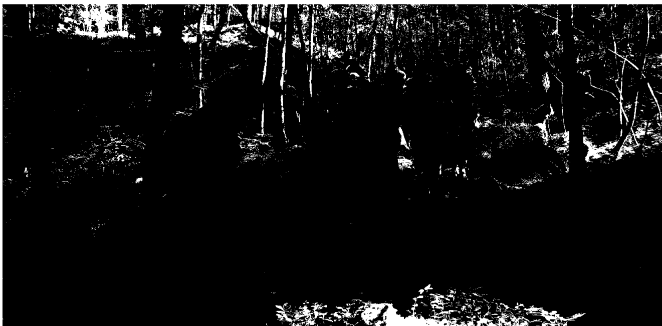
En av mange lokallag som har Gå med oss-grupper, er Nasjonalforeningen Sande helselag.

Vårt helsepolitiske arbeid omfatter også styrking av frivillighetens kår, blant annet søkbare midler