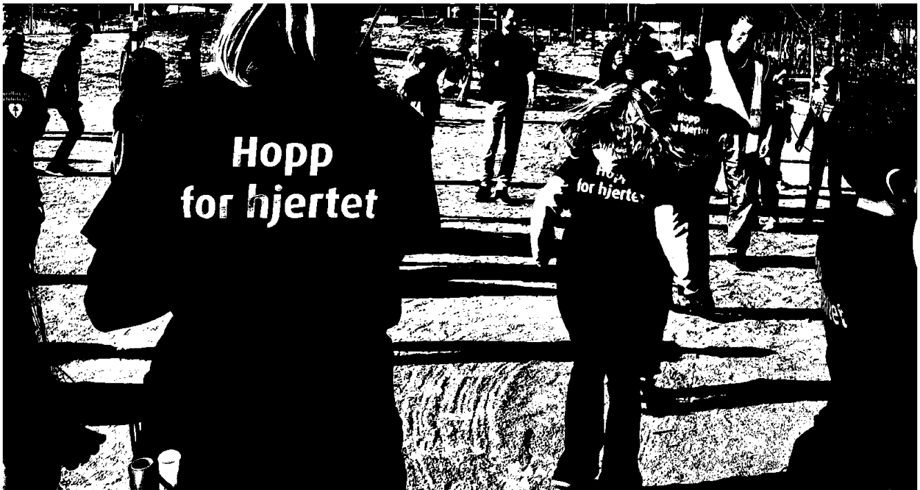
Årets hoppetaukonkurranse ble offisielt åpnet på Gystadmarka skole i Ullensaker kommune til full jubel for alle som deltok.

I 2022 ble 5,5 millioner kroner brukt til folkehelse og forebyggende arbeid.