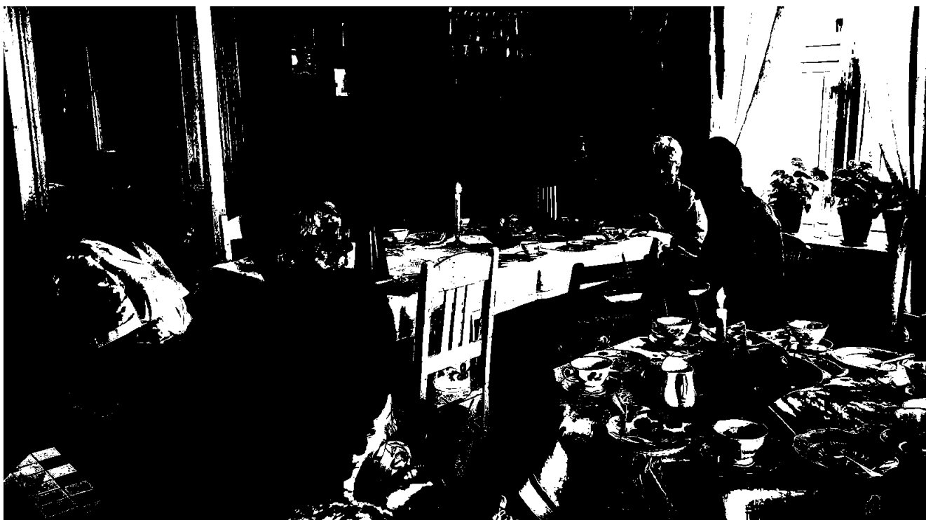
Nasjonalforeningen Helselaget Liv arrangerer jevnlig sine strikketreff. Det sosiale samværet er like viktig som håndverket.