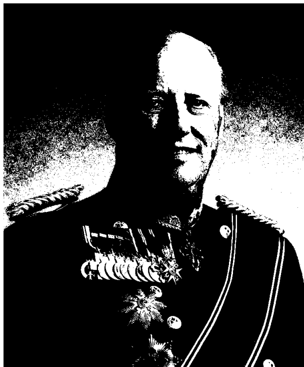
H. M. Kong Harald V Nasjonalforeningen for folkehelsens høye beskytter