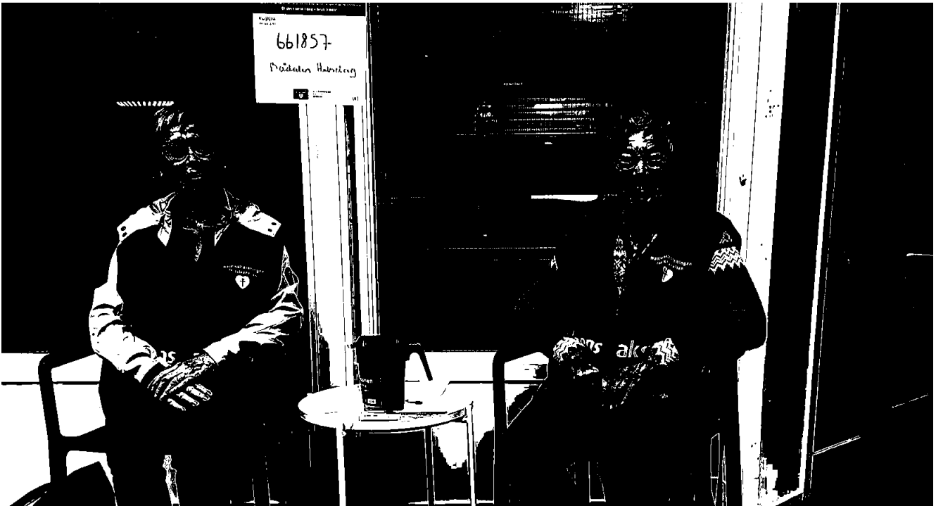
Nasjonalforeningen Bådalen helselag er ett av flere lokallag som deltok i årets Demensaksjon.

Organisasjonen plasserer sine verdier innen rammene som er angitt i vedtatt forvaltningsstrategi. Midlene forvaltes på en måte som ivaretar hensynet til sikkerhet, risikospredning og likviditet. Avkastningen søkes maksimert innenfor rammer gitt i forvaltningsstrategien. Kortsiktig likviditet plasseres 30-100 prosent