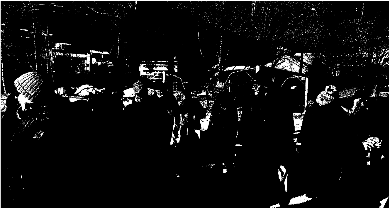
Nasjonalforeningen Fagernes helselag har mange aktiviteter gjennom året, blant annet samling rundt bålpanne med servering av pølser og buljong.

Nasjonalforeningen for folkehelsen har inngått avtale om inkluderende arbeidsliv, og fortsetter å jobbe systematisk med hensyn til oppfølging og tilrettelegging, for å forsøke å redusere sykefraværet.