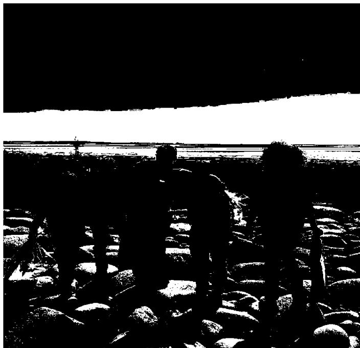
Plastinnsamling langs kysten, Ren Skjærgård 2022