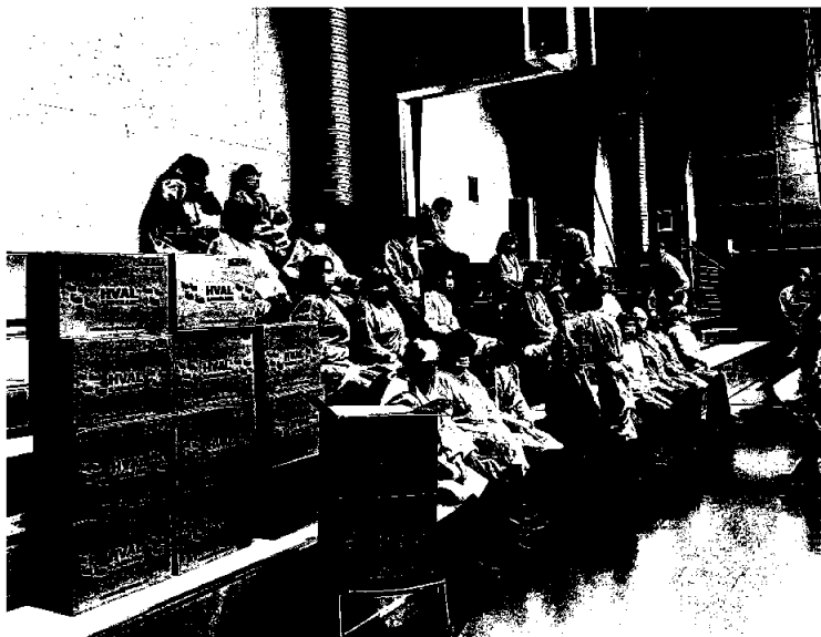
Utdeling av sjokolade som påskjønnelse til alle frivillige ved vaksinesentralene i Tønsberg og Færder under coronaen.