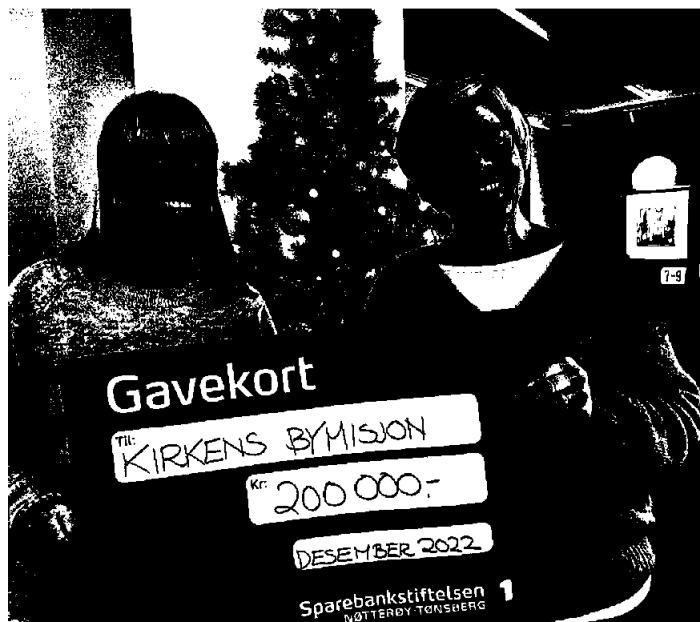
«Jul i en kasse» til utsatte familier før jul