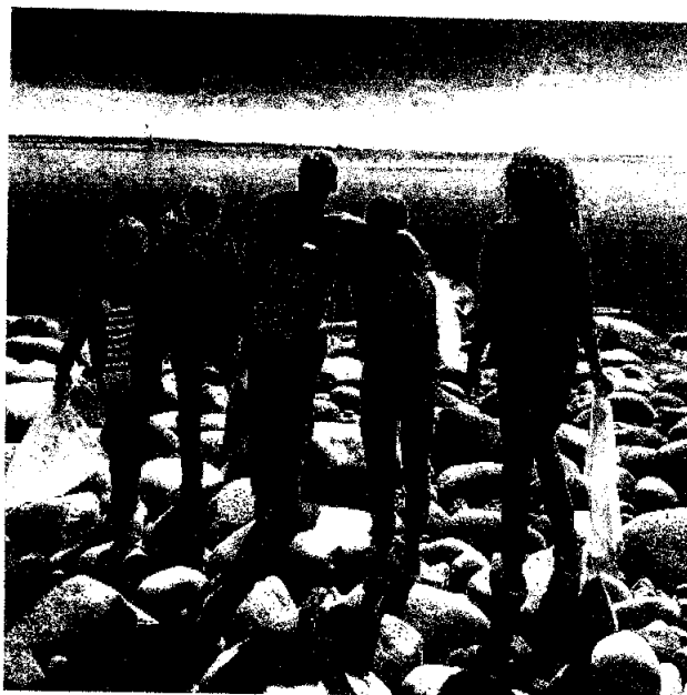
Plastinnsamling langs kysten, Ren Skjærgård 2022