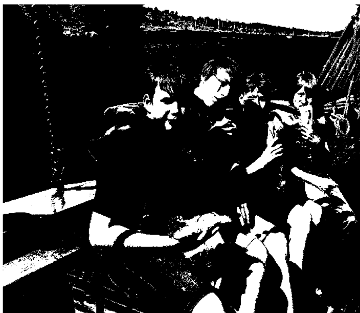
Ukrainske flyktninger på tur i skjærgården