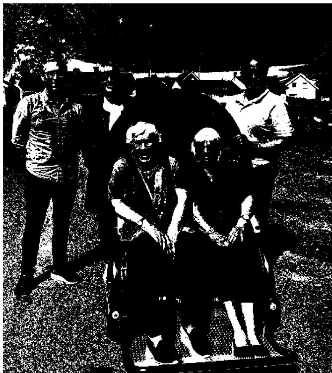
Mobilitetsstøtte for eldre