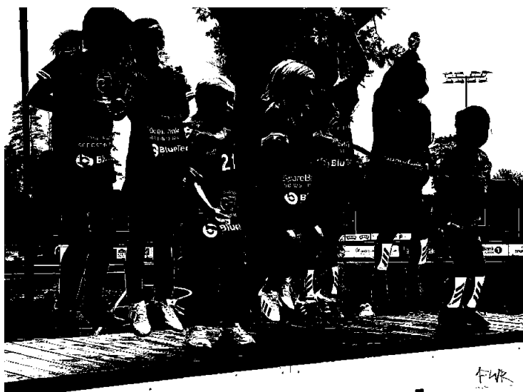
Vi har støttet barneidretten i hele regionen.