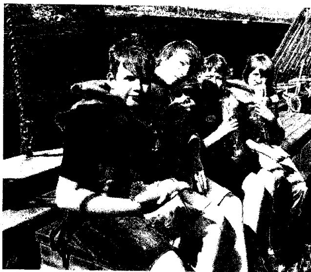
Ukrainske flyktninger på tur i skjærgården