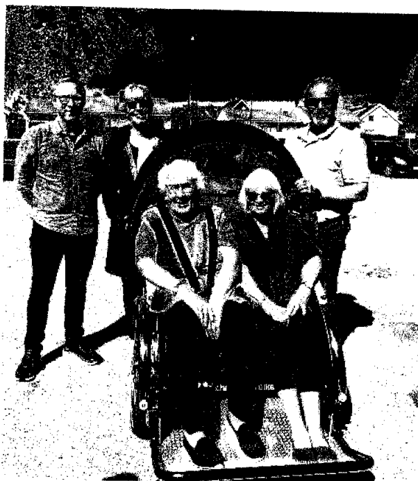
Mobilitetsstøtte for eldre