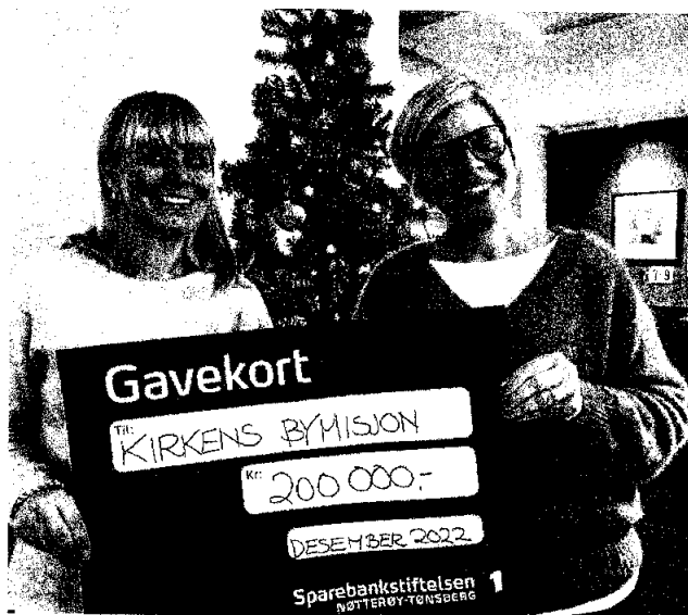
«Jul i en kasse» til utsatte familier før jul