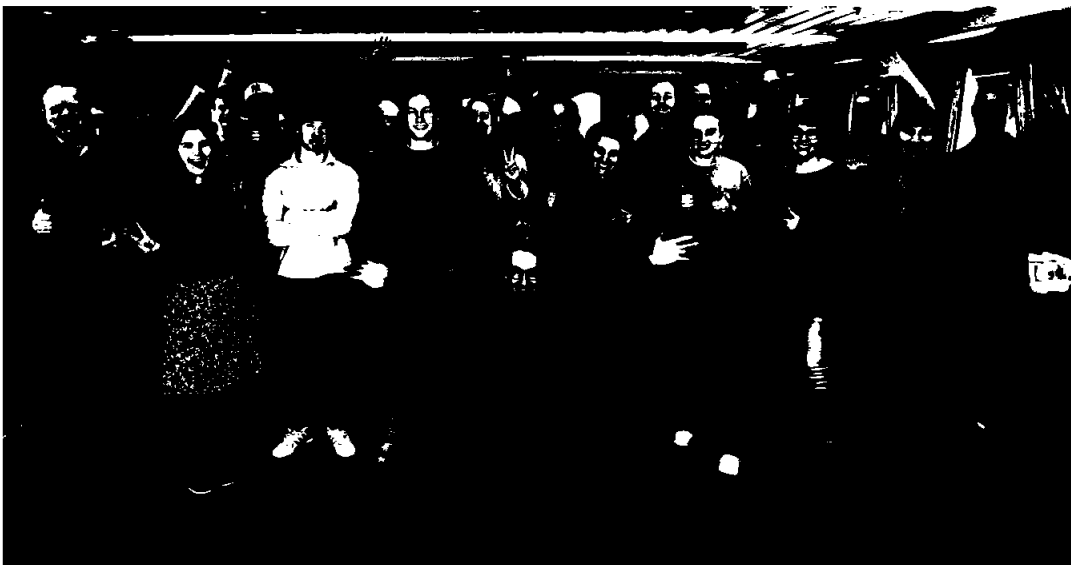
Deltkere under workshopen i Hunderfossen 20. - 21. november.

20. og 21. november inviterte Energisenteret og Vevig til workshop om «Energimontøren», som er navnet på prosjektet knyttet til øvingsarenaen for energimontører. Det er nettselskapene i Innlandet som finansierer prosjektet, og det var derfor representanter fra disse selskapene som deltok, totalt ca. 30 i tallet. Fasilitator for workshopen var «Senter for livslang læring» ved Høgskolen i Innlandet.