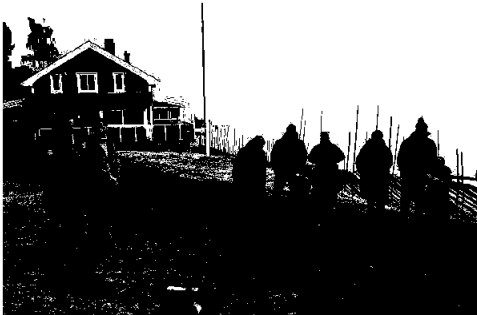
Markdag 2024, vertskapet ønsker velkommen til Hovdal Gård

Dagen ble avsluttet på Hagatun hvor det ble mer informasjon fra allmenningen. Dagen ble avsluttet med middag.