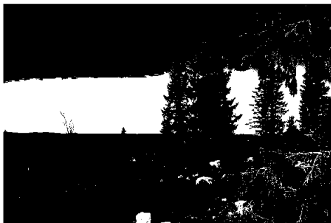
Birkebeinerbakken Øst

Allmenningen har i 2024 jobbet sammen med kommunen om et innspill fra Brøttum Almanning til ny kommuneplan. Dette er et viktig arbeid som vil fastsette hvilke arealer allmenningen kan utvikle til nye tomteområder i framtiden.