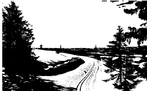
Utsikt fra skiløype i Birkebeinerbakken Panorama

Penneo Dokumentnøkkel: ONPFP-77OK4-2CTV5-2C85U-028WU-UCLPLA