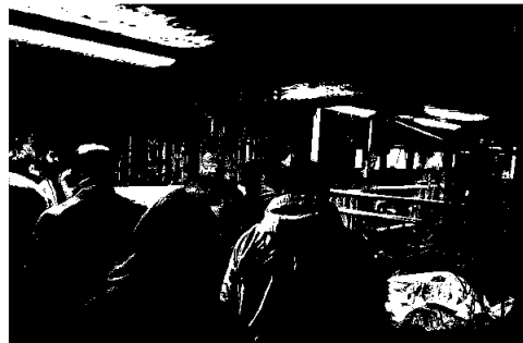
Markdag 2024, besøk i fjøset på Lohnsvea