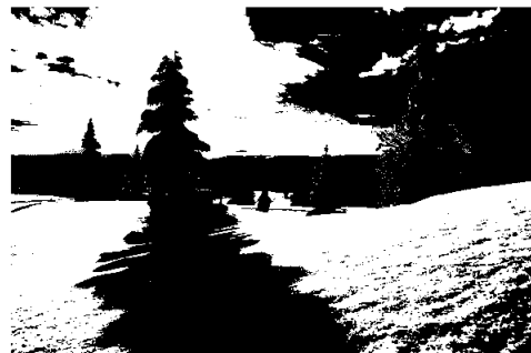
Birkebeinerbakken Øst

Allmenningen samarbeider bra med Sjusjøen Vel omkring fastsettelsen av det årlige nivået på brukerbetalingen i allmenningens hytteområder, slik det har vært praktisert de siste årene.