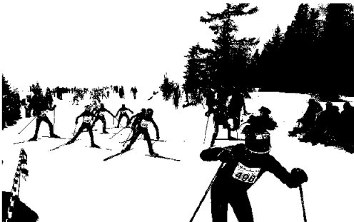
Full innsats i Monsterbakken Opp