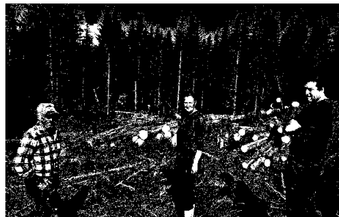
Styrebefaring hogst, Svartåshøgda