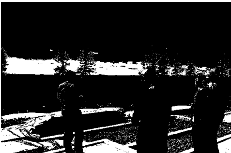
Styrebefaring Birkebeinerbakken Øst

Det har i 2024 ikke vært registrert klager på allmenningens skogsdrift.