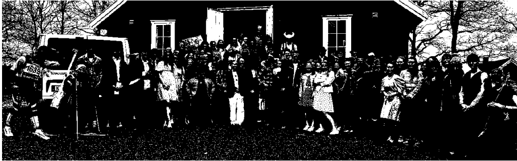
Rollebryllup våren 24 var et fantastisk høydepunkt 😊