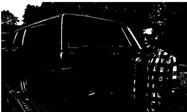
På Vg2 TIF er det mange som mekker på egne kjøretøy