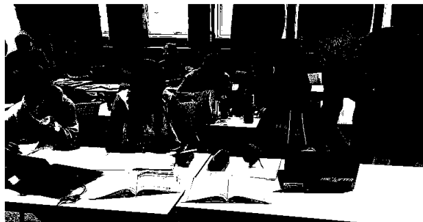
Fellesfag – en viktig del av skolehverdagen