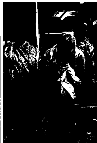
Dissikering av hest