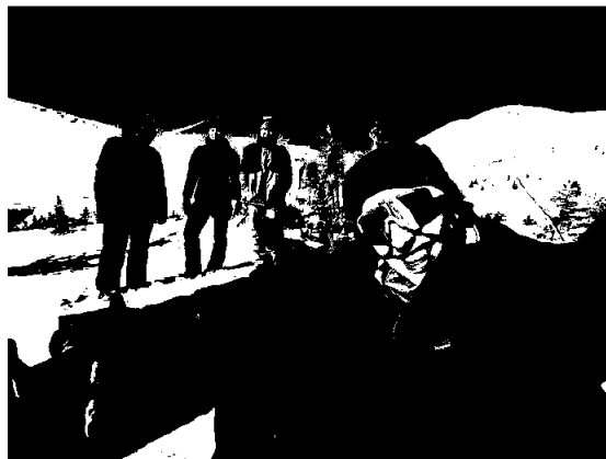
Friluftsliv: Lokale opplevelser som fuglemerking og flotte friluftsturer.