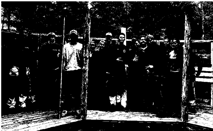
Vg2 tømrer har bygget en lavvo for Råde kommune på Strømnesåsen