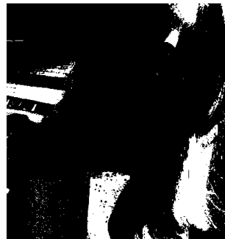
Medlemsbesøk til Øygarden i juni 2021.

Virksomheten forsøker også å redusere sitt miljøfotavtrykk, blant annet ved å utføre flere møter via Teams. Dette har av velkjente årsaker vært ekstra aktuelt også i 2021. På grunn av reiserestriksjoner har kontoret hatt få reisedager i 2021 sammenliknet med et «normalår», og mange av våre vanlige aktiviteter har blitt gjennomført digitalt. Dette gjaldt spesielt første halvår, da begge ansatte jobbet på hjemmekontor. Samtidig har det vært viktig for VNB å utnytte tilstedeværelsen hjemme i regionen høsten 2021, og vi har gjennomført fysiske medlemsbesøk til blant annet Øygarden, Kvam og Stranda. Kontoret har også deltatt på flere større, fysiske arrangementer, som eksempelvis Hardangerkonferansen.