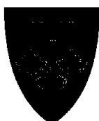
Møre og Romsdal