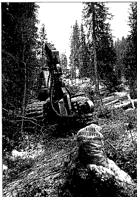
Samling av kongler for testing av 2010-årgangen.

Dokumentasjonsprosjektet – systematisering av eksisterende forsøk i database. Klonarkivarbeid.