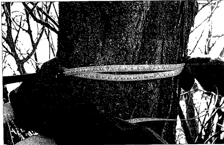
Tindvedkjempe ved Gaulosen

På våre nettsider er det utarbeidet en oversikt over store trær i Trøndelagsfylkene. I løpet av 2010 ble det rapportert inn toppnoteringer av 2 svartor og 3 tindved. Vi regner med at det finnes enda større trær av enkelte treslag, og vi mangler måleopplysninger for flere treslag.