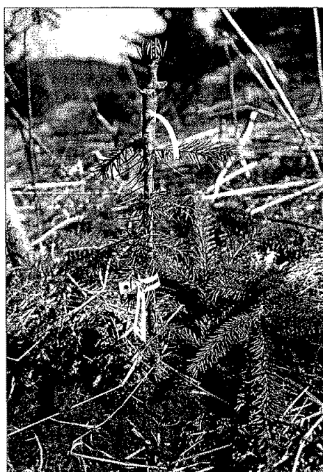
Flytting av Lyngdalskloner til Selbu.