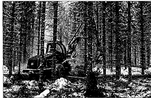
Fra tynningsdrifta i Skjørholmskogen, Verdal, januar 2010.