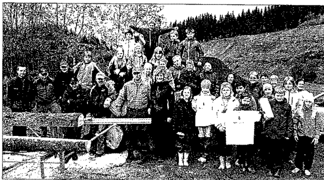
Skoleskogdag i Klæbu. Et samarbeid med Klæbu Skogeierlag.

Skogselskapets tilbud til kommunene gjennom Klimaråd Underveis ble i liten grad benyttet i 2010. LENSAs var derfor langt mer aktivitetsskapende.