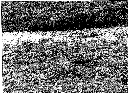
Hauglagt klimaskogfelt i Flatanger

I løpet av 2010 ble prosjektet fullført og sluttrapport publisert. Til sammen ble det etablert 4 klimaskogfelt i kommunene Namsos og Flatanger. Som en bieffekt av prosjektet ble det i 2010 lagt ut gavekort for klimakvoter til salg via www.plant-tre.no . Prosjektet har skapt nasjonal interesse og Skogselskapene i Trøndelag vil i 2011, sammen med DnS, vurdere å videreutvikle konseptet og tilby kvotesalg på nasjonalt nivå.