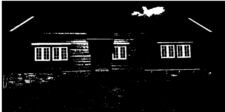
Huset i Hjortedalen med nytt tak og nymåla