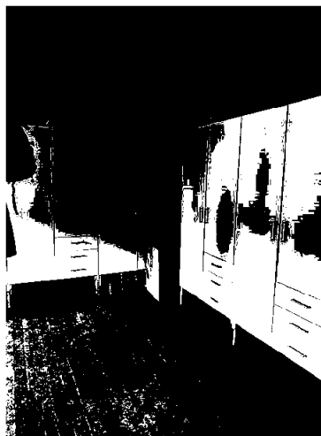
Ryddet og montert nye skåp i nord.