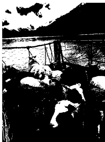
På veg heim på flåten over fjorden.