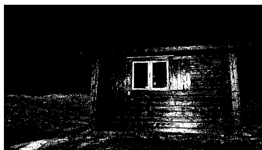
Hytta ved Tverrelva nymåla.