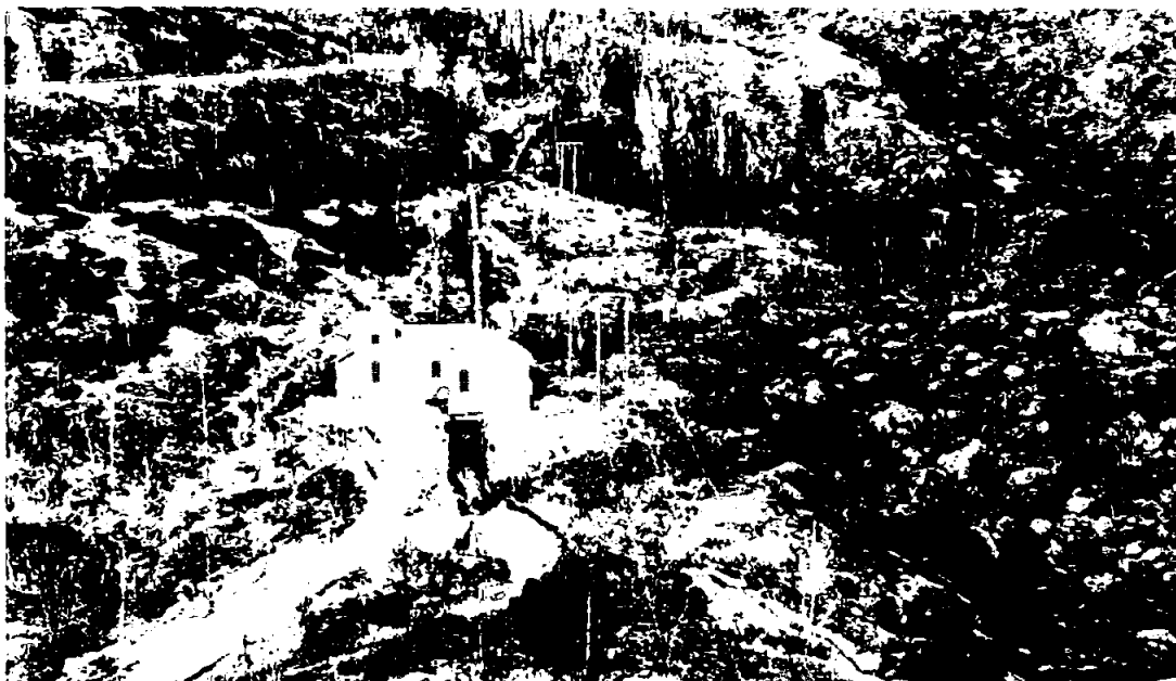
Biletet syner Tveitafoss Kraftstasjon. HE har søkt NVE om konsesjon om å nær dobla produksjonen her.

Det tidlegare samarbeidet i Lokalkrafta er avvikla og aksjane selt i 2022.