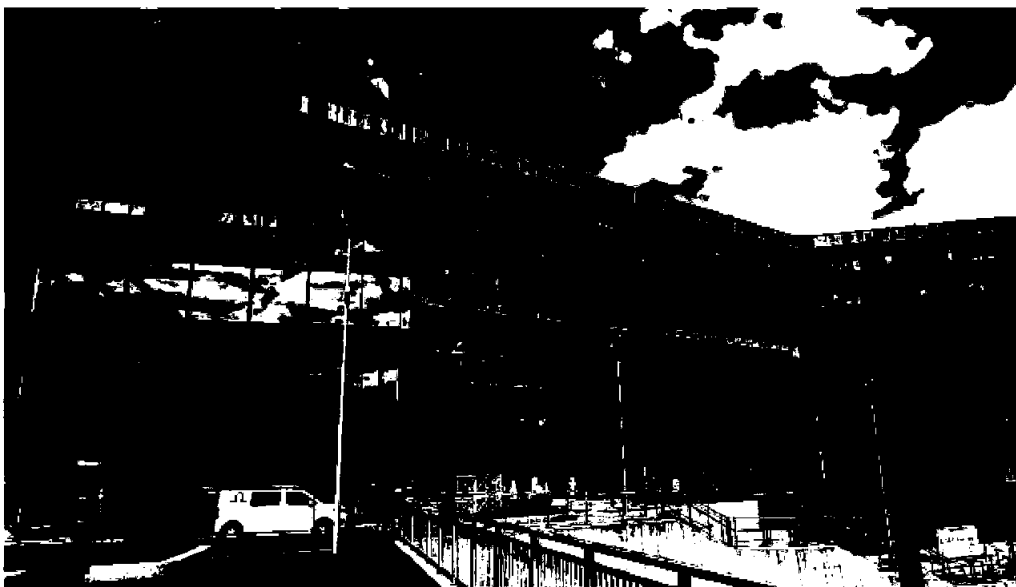
17. juli flytta Helse Vest IKT i Bergen inn i nye lokaler i Kronstad X.

No er dei fleste avdelingane med unntak av desse samlokalisert i Kronstad X. Håpet er at bygget skal bidra til eit samhald på kryss og tvers av avdelingar og fagområde og vere ein arena for samhandling og kollegialt samhald.