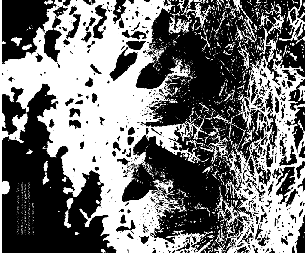
Guldet er stive AS husdyrresses eier som trenger klassifisering å gjøre. Disse girneve er fra en gård som er sertifisert med Dyrevernsmerket.