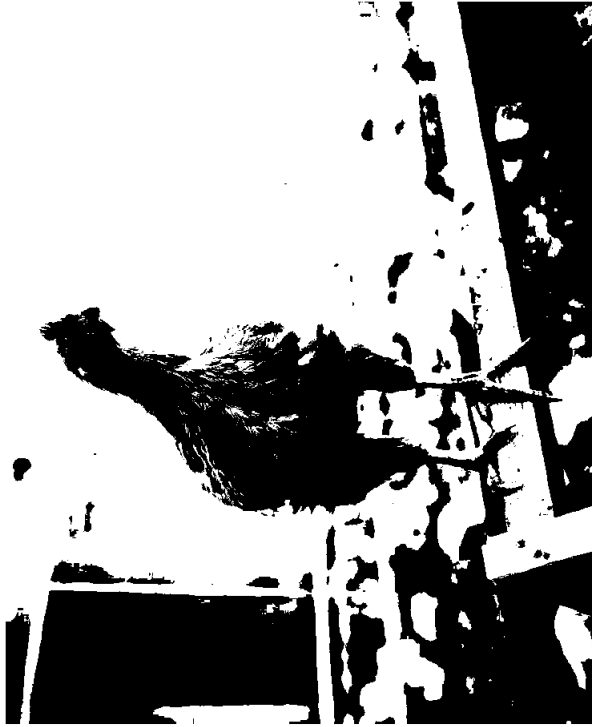
Kylling på en gård sertifisert med Dyreværnet.

Dyreverv: Viten gir deg forskning, politikk og næringslivsnyheter, og er for personer som arbeider med dyrevelferd på ulike måter. Viten utgis to ganger i måneden og går ut til over 4.000 personer.