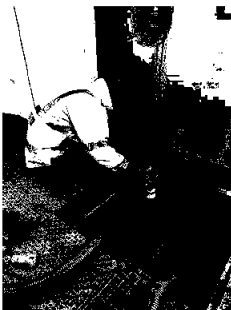
Figur 3.2: fra kalibrering av vannmengdemåler

Ranum renseanlegg er et anlegg i Våler kommune som behandles under forurensningsforskriftens kap. 13. Vannmengden på anlegget måles vha et v-overløp og en ultralydsensor. Vannmengdemålere viser ofte feil over tid, og DiH bistod derfor i 2020 med å kalibrere vannmengdemåleren.