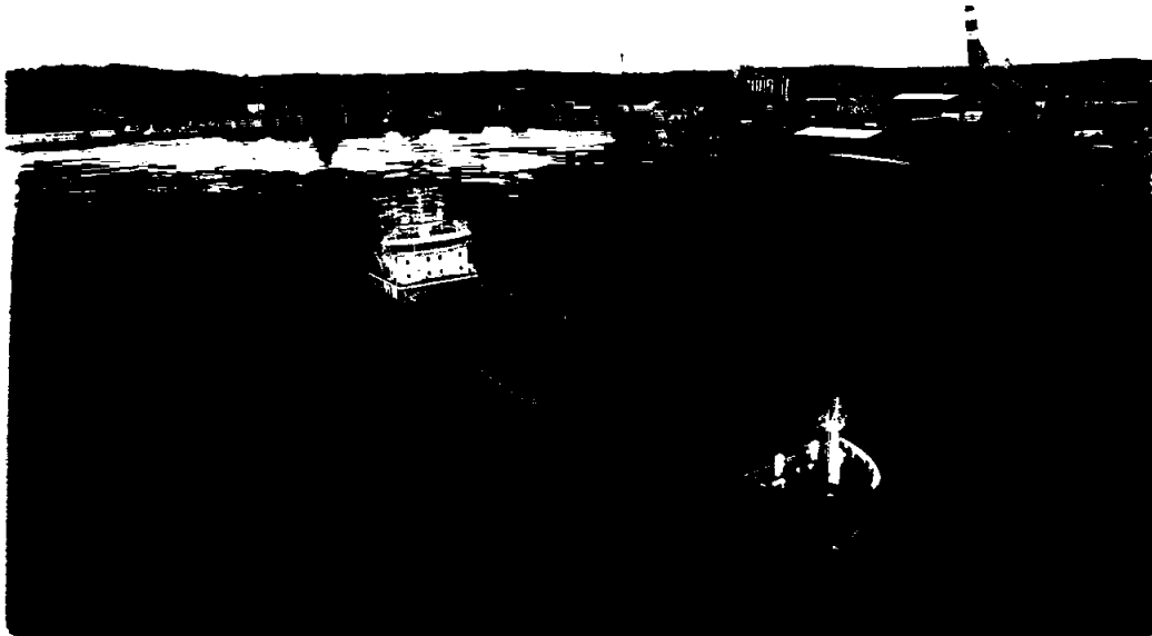
MS «Nor Viking» lastet med tømmer på utgående fra Porsgrunn.

Fra den årlige konjunkturrapporten til Norges Rederiforbund kan en lese at medlemsmassen blant short-sea rederiene, som selskapet er en del av, opplevde en beskjeden omsetningsvekst på 3 prosent i året som har gått. Når det gjelder forventningene til 2024, oppgir medlemsrederiene at de er moderate.