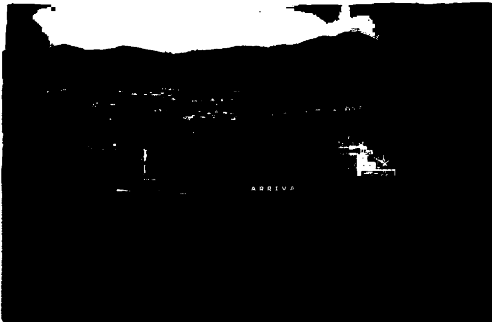
MS "Norjarl" passer Sotra i Øygarden kommune i Vestland fylke.

Ballastvannkonvensjonen, vedtatt av IMO i 2004 (trådte først i kraft 8. september 2017), regulerer inntak, utslipp og behandling av ballastvann og sedimenter for å begrense spredningen av fremmede arter. Konvensjonen krever at alle skip skal rense ballastvannet før utskifting, og at de skal ha IMO-godkjent utstyr for ballastvannrensing om bord innen første fornyelse av det internasjonale sertifikatet for hindring av oljeforurensning etter 8. september 2017. Per nå har 7 av 8 fartøy i Arrivas flåte installert ballastrensesystem, og det siste fartøyet vil få dette installert i 2024 i forbindelse med klassefornyelse.