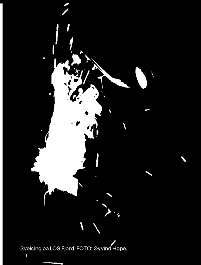
Sveising på LOS Fjord.