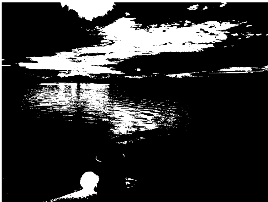
Kaffe på kaikanten Rørvik

Nord-Trøndelag Havn Rørvik IKS avgir regnskap i samsvar med bestemmelsene i regnskapsloven.