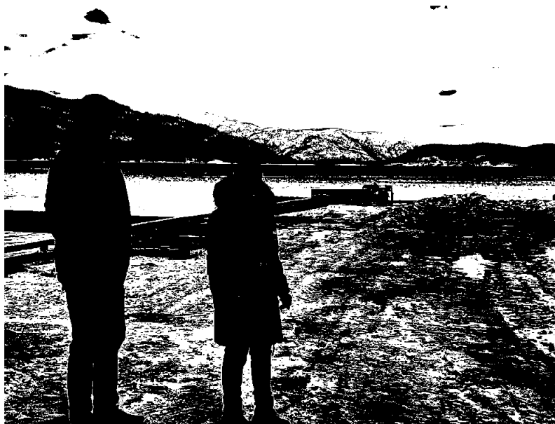
Befaring med ordfører i Bindal ved Brukstumta kai 2022