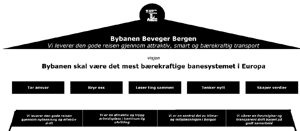
Fig. 1: Strategihuset – Strategisk fundament 2022-2025.

strategiske ambisjonene til selskapet. Dette er en strategi hvor forretning og bærekraft forenes i samme strategi og hvor bybanens bidrag til FNs bærekraftsmål er det overordnede målet for selskapet. Med mål om å være det mest bærekraftige banesystemet i Europa, med økt fokus på sirkularitet og livssyklustilnærminger i vår verdikjede og netto null utslipp innen 2030, skal vi bidra til at Bergen blir en bedre by å bo i for alle. Derfor har vi også FNs bærekraftsmål nr. 11 - Bærekraftige byer og lokalsamfunn, som vår ledestjerne. Vi skal bidra til å gjøre Bergen bærekraftig.