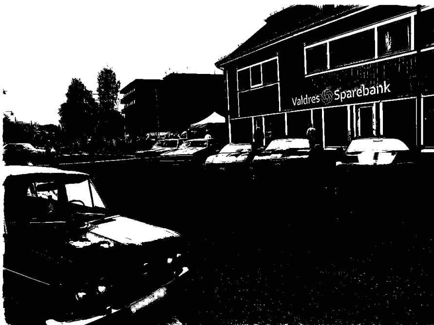
Foto: Fra Byfesten Fagernes

Bankens vedtatte strategiplan strakk seg over perioden 2019-2023, og denne ble videreført i påvente av ny strategiprosess. Det er gjennomført strategisamlinger for å legge ny strategiplan for banken. Strategiplanen skal være vårt redskap i driften av banken, og legge føringer for våre strategiske veivalg i de nærmeste årene.