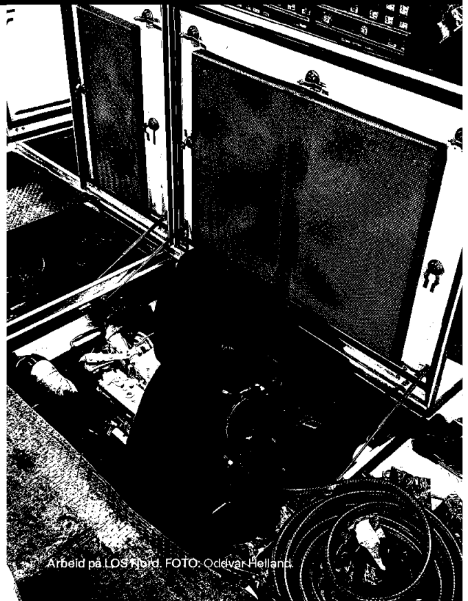
Arbeid på LOS Fjord.