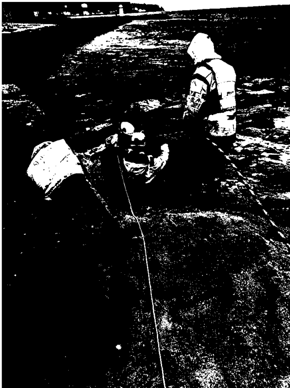
Selskapets finansielle posisjon ved utgangen 2022.

I samsvar med regnskapslovens § 3-3a bekreftes det at forutsetningen for fortsatt drift er til stede.