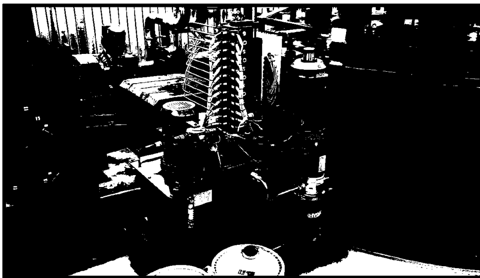
Del av produksjonsanlegget.

Rendalselva Kraftverk AS sin målsetting er å framstå som en miljøvennlig bedrift, og at den ikke forårsaker skade på eller tap av egen eller annens virksomhet.