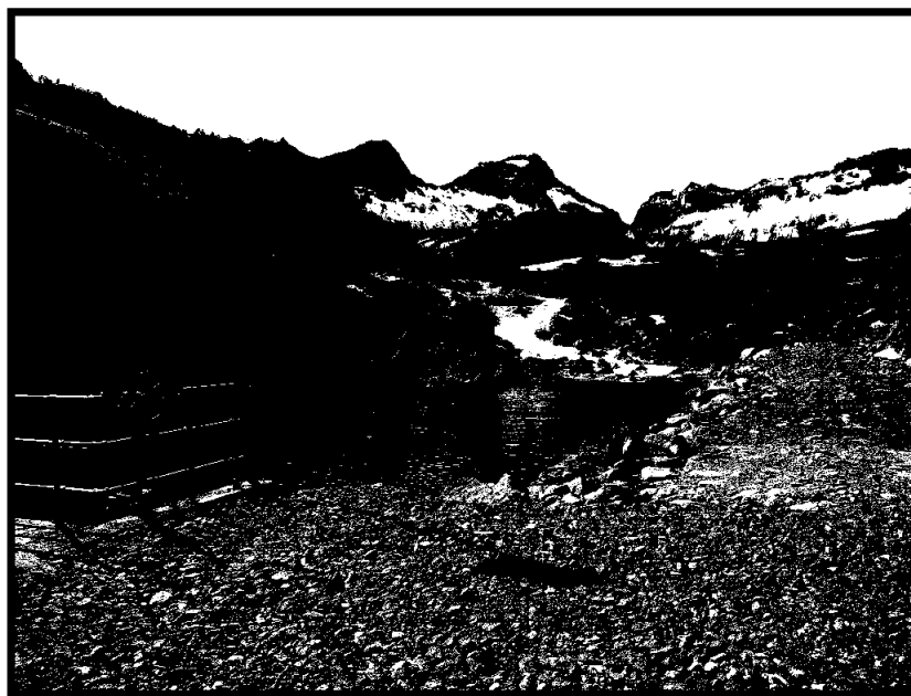
Området rundt demningen.

Det er planlagt en revisjons stans i løpet av 2021.