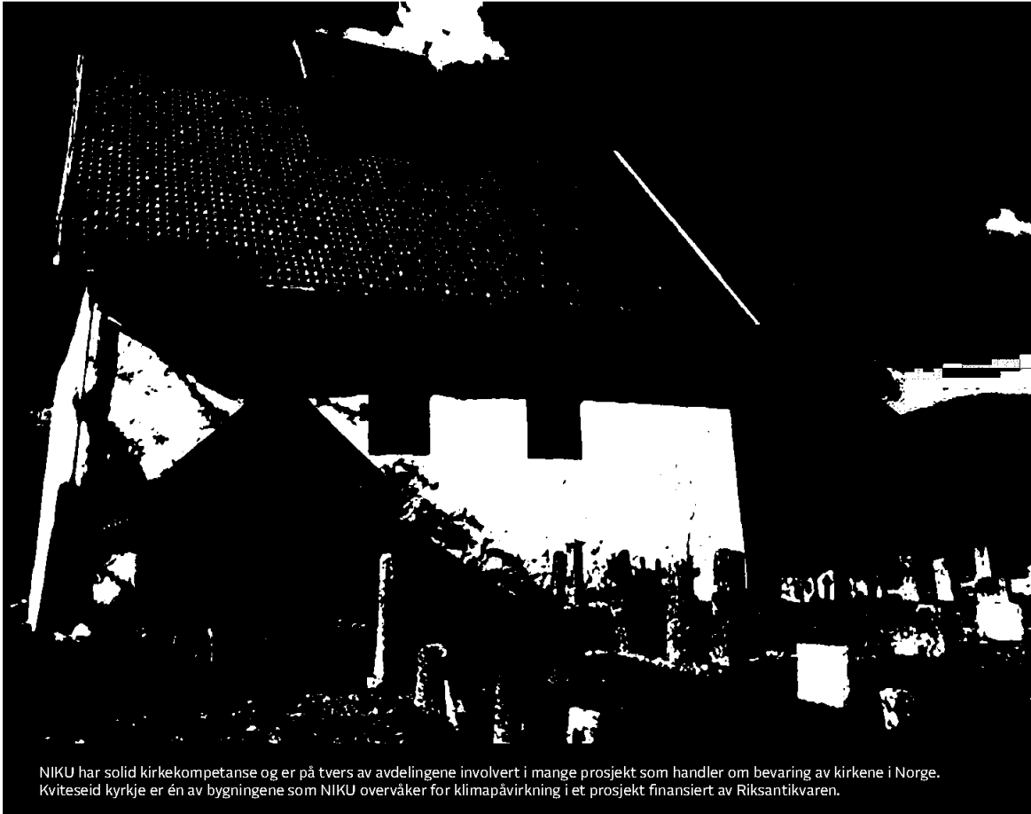
NIKU har solid kirkekompetanse og er på tvers av avdelingene involvert i mange prosjekt som handler om bevaring av kirkene i Norge. Kviteseid kyrkje er én av bygningene som NIKU overvåker for klimapåvirkning i et prosjekt finansiert av Riksantikvaren.

Pemco Dokumentnøkkel: DEUZ8-CAQYO-UB8B-8MKDC-EFEGJ-8DAOP