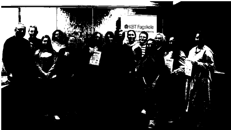
1KBT Fagskole og Prios har samarbeidet med et etableringskurs for ukrainske flyktninger. Deltakerne fikk kursbevis etterpå, og flere har gått videre med prosjekter.

Fylkeskommune: Opplæring for ukrainske flyktninger.