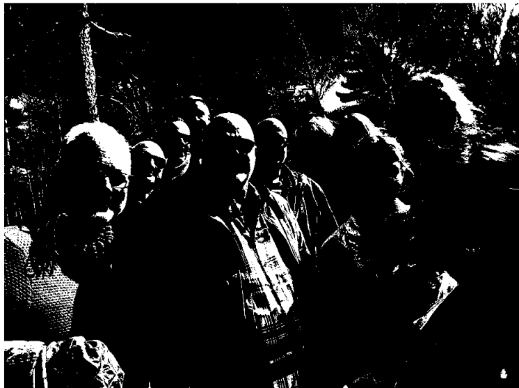
Styret og administrasjonen i Sørnorsk jazzsenter 2024-25