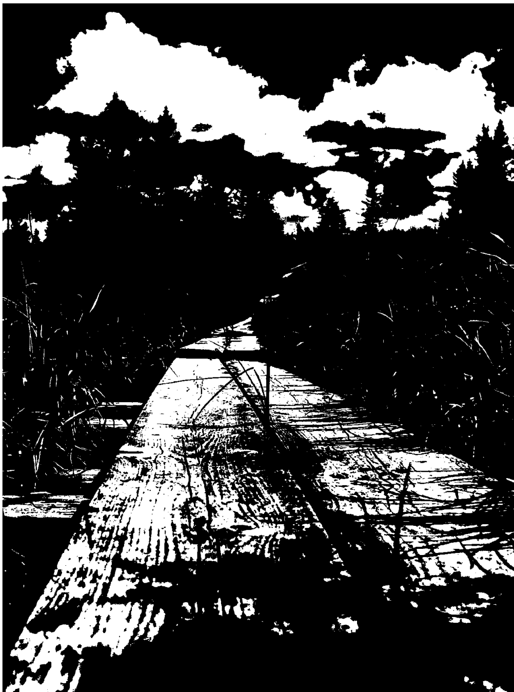
Veien videre.