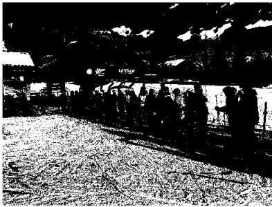
RASKO dagene: Alpin tilbudet er populært blant ungdommen.

Arrangementet ble godt mottatt fra ungdommene. ASKO bidro med servering gjennom arrangementet. Vi vil rette en stor takk til alle som deltok ved planlegging og gjennomføring.