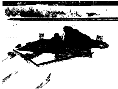
RASKO dagene 2024.