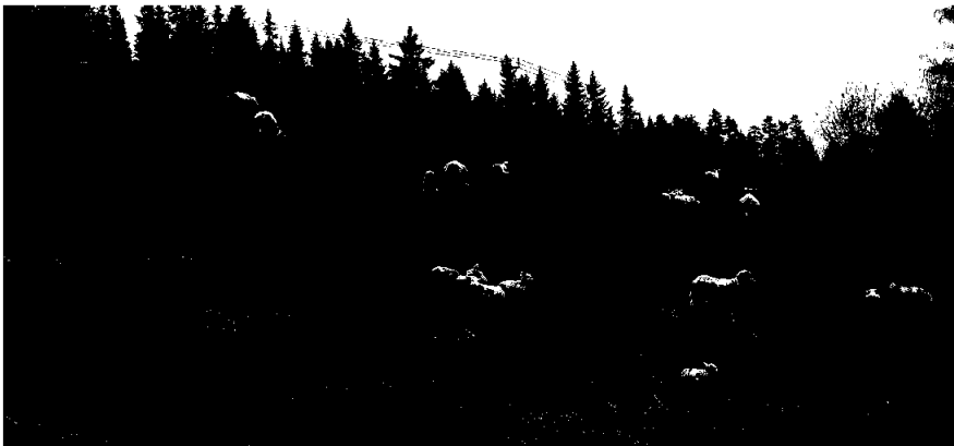
Sau på beite før vårslippet i fjellet.

Det er innført kvote for totalt antall beitedyr som kan tillates i beiteområdet. Egne retningslinjer er utarbeidet i Beiteutvalget. Det er forgrunnlaget som bestemmer antall dyr som kan slippes på det enkelte bruk. Ansvar for oppfølging av de fastsatte bestemmelser ligger til de enkelte lokallagenes styre.