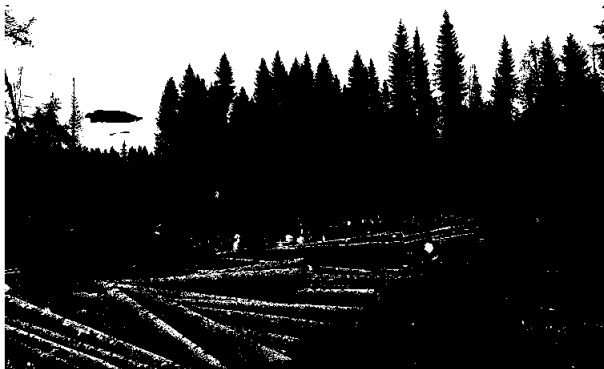
Hogst ved Khumsveien 2025, Lierhagen skogsdrift.

Det ble gjennomført informasjonsmøte for de bruksberettigede den 12. desember hvor styret og bestyrer gikk gjennom status for allmenningen. Det var påmeldt 83 bruksberettigede inkludert styret og administrasjonen. Møtet la opp til gjennomgang av status med fokus på dialog mellom allmenningen og de bruksberettigede.