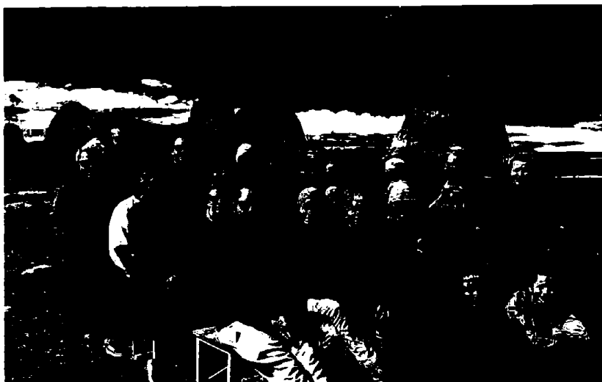
Årsmelding for Stiftelsen Grenland Folkehøgskole 2022