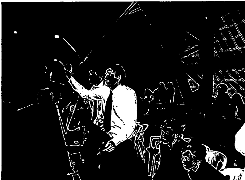
Coaches Barentscup 2007